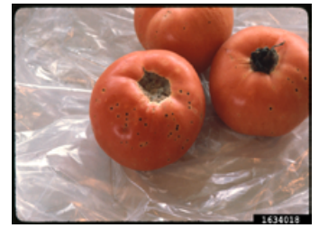
Typische Symptome infizierter Kulturtomaten. © Penn State University, Bugwood.org ; CC BY-NC 3.0

Insgesamt ist es das Ziel des PLANT 2030 Projektverbunds PATRIC der Transfer vom Laborwissen in die Anwendung, um umweltfreundliche Produktionssysteme zu ermöglichen. Ein wichtiger Faktor, der dabei den Ertrag und die Rentabilität begrenzt, ist die Schädigung von Nutzpflanzen durch Pathogene. Daher unterstützen die PATRIC-Forschungsgruppen eine wettbewerbsfähige und nachhaltige landwirtschaftliche Produktion durch ihre anwendungsorientierte Forschung am pflanzlichen Immunsystem.